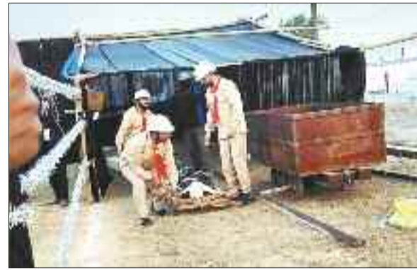
उपचार विधि का प्रदर्शन करते कर्मी।