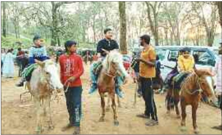
दलदली का भ्रमण करते पर्यटक।