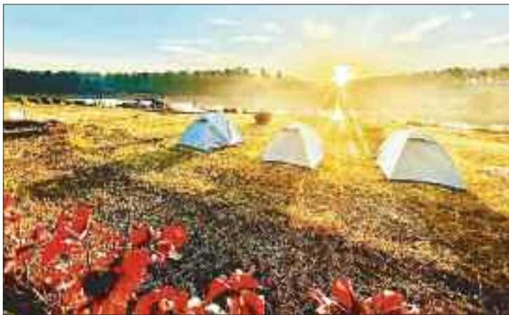
कार्निवाल स्थल पर पर्यटकों के लिए सजाए गए टेंट।